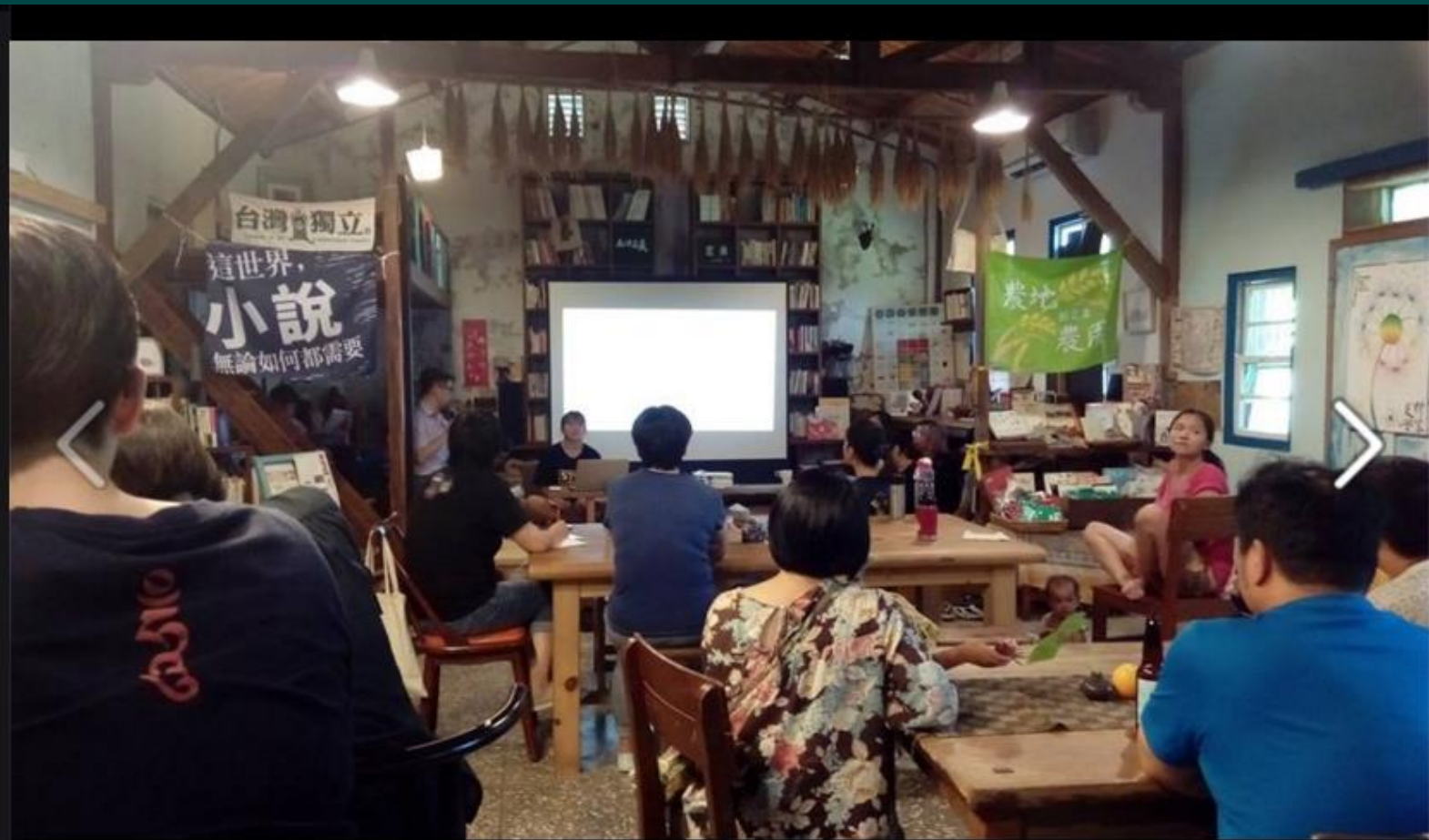
怪獸家長與公民社區：韓國Sungmisan village(城... 在怪獸家長與公民社區：韓國Sungmisan village{...